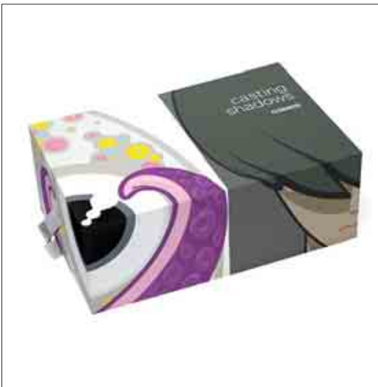
تصویر ۱-۳: عروسک کلکسیونی، (www.coarselife.com, 2012.4.1)