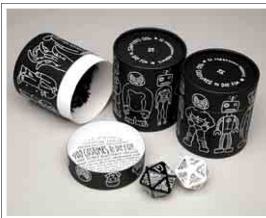
تصویر ۱-۲: اسباب بازی مخصوص جشن هالوین، تصویر ۱-۲: اسباب بازی مخصوص جشن هالوین،