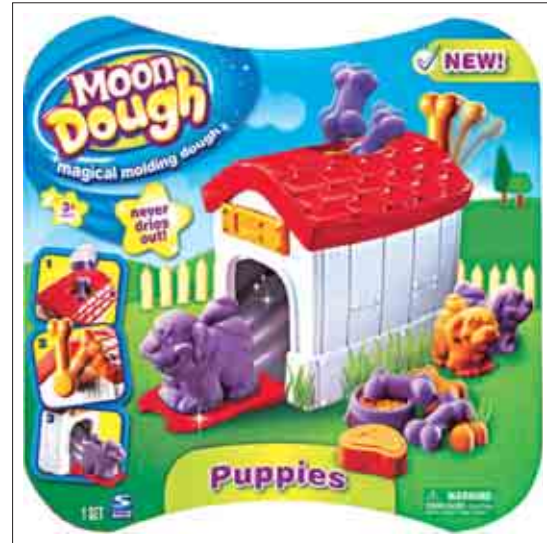
ج) 2012.3.6, www.toysrus.com, تصویر ۵-۱: نمونه‌های خارجی پژوهش.