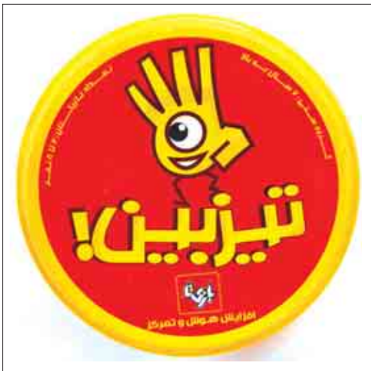
ج) تصویر ۶-۱ نمونه‌های ایرانی پژوهش

حجم اطلاعاتی که تصویرساز بسته‌بندی مجبور به نشان دادن آنها است در بازی‌های مختلف متفاوت است و اغلب حجم بالایی دارد از این رو ایجاد تصویرسازی که بتواند تمام این اطلاعات را به مخاطب منتقل کند کار آسانی نخواهد بود. آنچه بر روی بسته درج می‌شود در ارتباط با بسیاری موارد است. خواه این منبع تصویری، عکس باشد و خواه تصویرسازی به نحوه عرضه محصول و مزیت‌های رقابتی آن بستگی دارد. اینکه محصول مخصوص کدام سن است؟ چگونه مورد استفاده قرار می‌گیرد؟ و آیا نشان دادن محصول برای جذابیت بسته ضرورتی دارد و یا خیر؟ در واقع طراحی بسته‌بندی و تصویرسازی آن به هویت یکپارچه بصری نام تجاری و سیاست‌های بازاریابی، فروش و عملکرد رقبا باز می‌گردد. اما با این حال و با توجه به نمونه‌های مورد بررسی تحقیق برخی ویژگی‌ها به طور عمومی کاربرد بیشتری یافته‌اند: