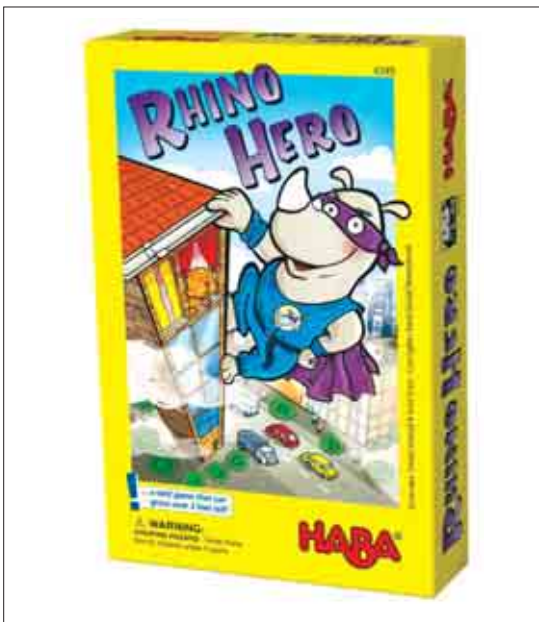
ب) (www.haba.de, 2012.6.1)

مشاهده می‌شود. الف) اسباب بازی کمک آموزشی ( کارت بازی ج) اسباب بازی لانه شگ و در تصویر ۶-۱ نمونه‌های ایرانی متفاوت دیده می‌شود. الف) عروسک‌های نمایشی شادی رویان ب) کاردستی بازی تا ج) کارت بازی.