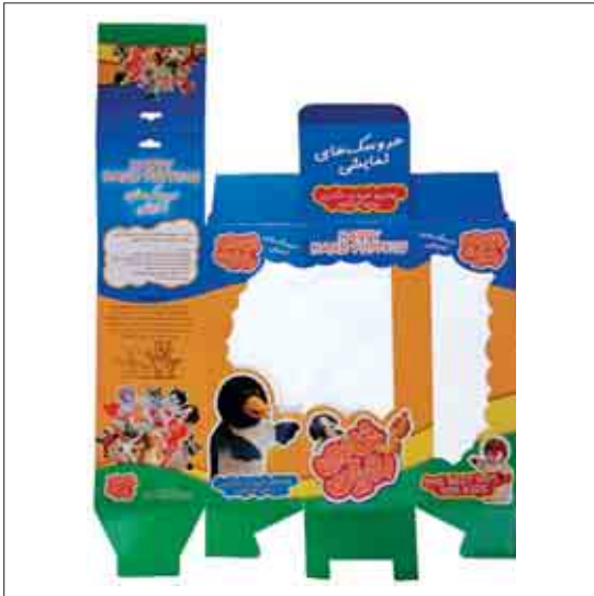
الف) عکس از پژوهشگر، ۱۴.۷.۱۳۹۱