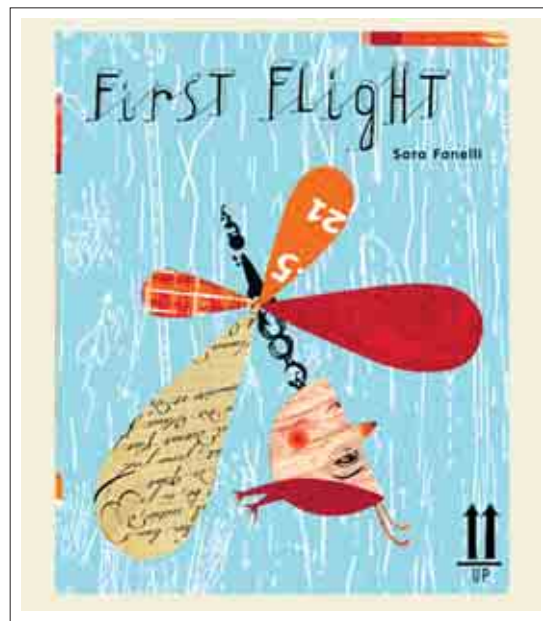
تصویر ۸: تصویرگر، سارا فانلی، اولین پرواز

نیروی جاذبه‌ی زمین مقاومت نماید. گاهی معکوس کردن عناصر بر انتقال مفاهیم و مفهوم رسانی موثر واقع می‌شود. سارا فانلی Sara Fanelli هنرمند اهل کشور ایتالیا و دارنده جوایز متعددی می‌باشد، از جمله جایزه‌ی موزه ویکتوریا و آلبرت «Victoria and Albert Museum» در انگلستان (سایت شخصی هنرمند). وی هنرمندی مفهوم‌گرا است که با تکنیک کلاژ و به شیوه‌ی انتزاعی، طرح‌های مبتکرانه‌ی خویش را عرضه می‌نماید. تصویر ۸، تصویرسازی برای روی جلد کتاب «اولین پرواز» می‌باشد. هنرمند با توجه به محتوای مضمون، جسورانه کاراکتر و شخصیت داستان خویش را بلعکس، و با خطوط و فلش‌های پس‌زمینه جهت و حرکت ایجاد کرده است. وی با رویکردی خلاقانه توانسته از ترکیب حروف درون سطوح رنگی، بافت‌های متغیر و فرم‌های ساده شده، به یک چیدمان منحصر به فرد دست بیابد. (تصویر ۸)