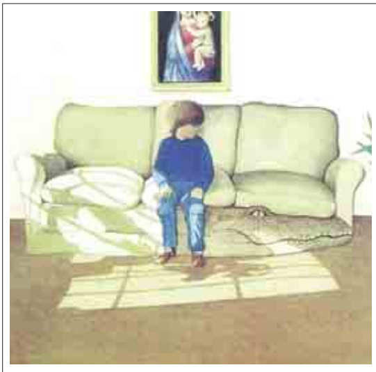
تصویر ۷: تصویرگر، آنتونی براون، تغییرها.

این ویژگی بصری در بعضی از آثار آنتونی براون به خوبی به کار گرفته شده است. آنتونی براون «Anthony Browne» هنرمند نامدار و مبتکر انگلیسی و برنده جوایزی نظیر هانس کریستین آندرسن و مدال کیت گرین وی، می‌باشد. وی نویسنده و تصویرگر متبحری است که با نگاهی خلاقانه از ویژگی‌های فرمی اشیاء برای نزدیک کردن و یا تبدیل آنها به عناصری دیگر بهره می‌گیرد. تصویر زیر نمونه‌ای از کتاب تغییرها است که آنتونی براون نویسنده و تصویرگر آن می‌باشد وی تصور تغییر اشیاء منزل در ذهن پسرچه‌ای را در نمایش یک دگرذیسی سازمان یافته و متناسب با کل فضا سازی داستان روایت می‌نماید. (تصویر ۷)