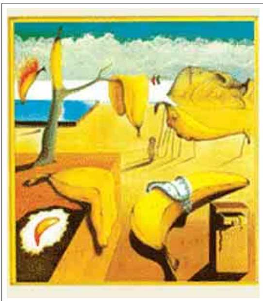
تصویر ۹: تصویرگر، آنتونی براون

مدرن و فرهنگ عامیانه هستند. این جزئیات ظریف و نلمحوس که به نقاشی‌ها، مجسمه‌ها، کتاب‌های مشهور، تیپ‌ها و موقعیت‌های افسانه‌های عامیانه، شخصیت‌های معروف جامعه، شخصیت‌های کتاب‌های خود نویسنده و حتی تجربه‌های زندگی شخصی او اشاره دارند، به طور غیر مستقیم به آشنایی و درک عمیق‌تر خواننده از شخصیت‌های کتاب و در نهایت خود او می‌انجامند» (محلوجی، ۱۳۸۰، ۱۸۰) تصویر ۹، صحنه‌ای از کتاب ویلی خیال پرداز «Willy the Dreamer» (۱۹۹۷) را نشان می‌دهد. ایده‌ی خلاقانه‌ی براون برای اقتباس از اثر معروف سالوادور دالی «Salvador Dalí»، به نام تداوم حافظه بسیار هوشمندانه می‌باشد. این کتاب رویاهای یک میمون کوچک را در خواب بازگو می‌کند. در اینجا با توجه به رویاهای شخصیت اصلی داستان، میوه‌ی موز به جای ساعت جایگزین شده است. (تصویر ۹ و ۱۰)