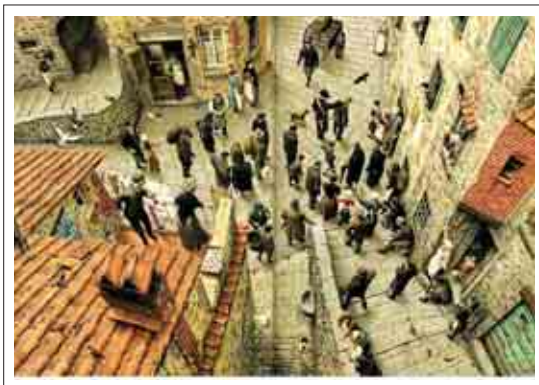
■ تصویر ۵: تصویرگر، روبرتو اینوچنتی

تغییر زاویه دید و نگاه در تصویرسازی می‌تواند بر گسترش هیجان و پویایی اثر تأثیرگذار باشد. تصویرگر می‌تواند سوژه مورد نظر خود را از قسمت بالاتر، پایین تر و یا درست از روبرو ثبت نماید. دید متفاوت تصویرگر به مخاطب این امکان را می‌دهد تا تجربیات بصری متفاوت و جدیدی را تجربه نموده و همچنین زاویه نگاه خویش را با ساختاری سازمان یافته، مانند هنرمندان سبک کوبیسم در هم شکسته یا دگرگون نماید. روبرتو اینوچنتی Roberto Innocenti (۱۹۴۰) تصویرگری خلاق، به نام و نکته سنج ایتالیایی می‌باشد. وی دریافت کننده جایزه‌هایی نظیر هانس کریستین آندرسون و سیب طلای براتیسلاوا می‌باشد. اینوچنتی شاکارهای خویش را با استفاده از تکنیک آبرنگ، با رعایت جنبه روایتگری بصری داستان و توجه به جزئیات دقیق فیگوراتیو به صورتی کاملاً واقع‌گرایانه خلق می‌نماید. «پرسپکتیو و زاویه دید از جمله عناصری است که تصویرگر می‌تواند با دگرگون کردن آن بیننده را تحت تأثیر قرار دهد. اینوچنتی همواره با سود جستن از این شگرد در فضایی به گستره دو صفحه روبروی هم بیننده را به ژرفای آثار خود فرا می‌خواند.» (فائینی، ۱۳۹۰، ۲۵۹) وی با زاویه دیدهای شگرفی که در طراحی تصاویر خویش اعمال می‌نماید به سرعت ذهن مخاطبین را شگفت زده، غافلگیر و مبهوت می‌نماید. وی همچنین توجه ویژه‌ای به فضا سازی با رویکردی دقیق به معماری ساختمان‌ها دارد. (تصویر ۵)