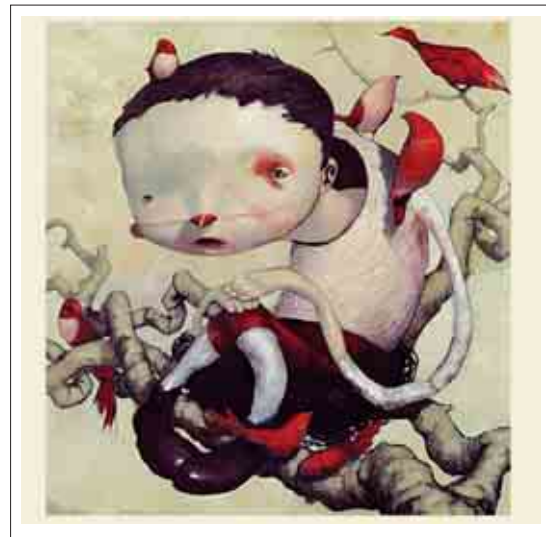
تصویر ۶: تصویرگر، جو سورن

جو سورن «Joe Sorren» هنرمند مفهوم گرای آمریکایی، در آثار خویش از تغییر و دفرماسیون به خصوص در پیکر انسان‌ها به گونه‌ای خلاقانه و با ایده‌هایی نو و بدیع برای انتقال حس درونی آن‌ها بهره می‌گیرد. محتوای آثار سورن بیانگر انسان محو، اغراق آمیز و سرشار از احساس انزجار، تنهایی و از خود بیگانگی می‌باشد. تصویرسازی‌های جو سورن برگرفته از تفکرات و ادراکات درونی و تجربیاتش می‌باشد. وی ماهیت حسی و درونی عناصر را به وسیله دفرمه‌سازی نمایان می‌کند. جهانی که سورن خلق می‌کند مختص به وی و الهام بخش هنرمندان جوان بسیاری می‌باشد. (تصویر ۶) نگاه خلاق هنرمند به جهان پیرامون، تغییر و جابه‌جا کردن عناصر مختلف، تبدیل اشیاء به عناصر گوناگون و... همگی تمرین‌هایی هستند که ذهن ما را برای ارائه و تولید ایده‌های نو رهنمون می‌کنند.