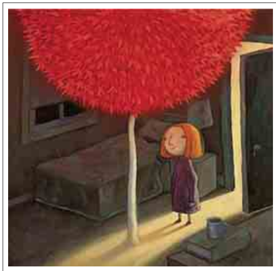
■ تصویر ۱: تصویرگر، شان تن، درخت سرخ.

رابطه مرتبط و غیرمرتبط که با عنوان رابطه «مستقیم و غیر مستقیم» نیز به کار گرفته شده است ۱ ، همواره بین عناصر و کلمات وجود داشته است. «گاهی این ارتباط مبتنی بر وجه مستقیم می‌باشد مثل: لیوان و آب، دریا و آب و... گاهی هم این ارتباط مبتنی بر هم آمیزی دو تصویر با ایده‌های متفاوت هست. در اینجا توجه ما معطوف بر وجه غیر مستقیم موضوع می‌باشد» (ورامینی، ۱۳۹۰، ۲۴) ما می‌توانیم از ترکیب عناصر غیر مرتبط به مفاهیم جدیدی دست پیدا کنیم. جاذبه بصری و اعمال بسیاری از عناصر خلاقه می‌تواند از طریق ایجاد رابطه‌های غیرمستقیم، در بین عناصر متضاد بدست آیند. در (تصویر ۱) اثر هنرمند نامدار و خلاق استرالیایی شان تن «shaun tan» مشاهده می‌شود. وی برنده جایزه‌های اسکار، هانس کریستین آندرسن و یادبود آسترید لیندگرن، می‌باشد. تصویرسازی‌های مطالعه شده «تن» بسیار پرمایه و مفهومی می‌باشند. وی در آثارش همواره از عنصر دگرسازی برای غنای تصاویرش بهره می‌گیرد. تصویر زیر آخرین صفحه از کتاب مصور درخت سرخ می‌باشد، این داستان کنش ذهن نومید دخترکی را بازگو می‌کند که دچار فقدان انگیزه گشته است. شان تن در این تصویر با سود جستن از دو عنصر فرم و رنگ، منظور خویش را که تداعی حس امید و سرزندگی پس از یک رخوت یأس برانگیز است عینیت می‌بخشد.