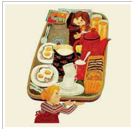
تصویر ۲: تصویرگر، اتینه دلست

برای ایجاد تشبیه و استعاره در تصویرسازی باید از فرایند متشابه کردن دو تصویر یا نماد بر اساس مشترکاتشان سود بجوییم. «نمادها می‌توانند جنبه استعاری داشته باشند. یکی از مسائل مهم در حوزه‌های مختلف هنری نقش و جایگاه نمادهای استعاری است.» (رجعی، ۱۳۸۹، ۲۲) به عبارت دیگر پیدا کردن شباهت بین دو عنصر مختلف و ترکیب یا جایگزین کردن آن‌ها برای خلق یک اثر منسجم، یکی از روش‌های اعمال خلاقیت در تصویرسازی محسوب می‌گردد. در استعاره برای تداعی یک شکل و تصویر، از عناصر ابزارهای غیر صریح، مختلف و متفاوتی استفاده می‌شود این عناصر باید وجه تلویحی با تصویر ما داشته باشند تا مقصود را در قالب موضوع مورد نظر، مناسب‌تر ارائه نمایند. ما باید همراه با چشم و ذهنمان برای پیدا کردن عناصر متضاد با یکدیگر سود بجوییم. هنگامی که در تصویرسازی از عناصر متضاد استفاده می‌نماییم، تصویر مفهومی و تفکر برانگیز می‌شود. با این حال تصویرگر می‌باید همواره به قابلیت، رویکرد و فضای متن اشراف کامل داشته باشد. اتینه دلست Etienne Delessert از هنرمندان نامدار و خلاق کشور سوئیس می‌باشد (۱۹۴۱) وی تاکنون توانسته است بسیاری از جوایز معتبر جهانی را از آن خود نماید. از جمله سیزده مدال طلا و دوازده مدال نقره از انجمن تصویرگران آمریکا، جایزه همپلتن کینگ و نامزدی جایزه هانس کریستین اندرسون (سایت شخصی هنرمند). دنیای رنگ‌های درخشان، زنده، مشخص و تفکیک‌پذیر، همراه با اغراق و دفرماسیون متناسب با مقطع سنی مخاطب، تضادها و استعاره‌های پرسش‌برانگیز و رندانه، و همچنین روایتگری ناب تصاویر از عوامل موفقیت زبان بصری این هنرمند می‌باشد. (تصویر ۲)