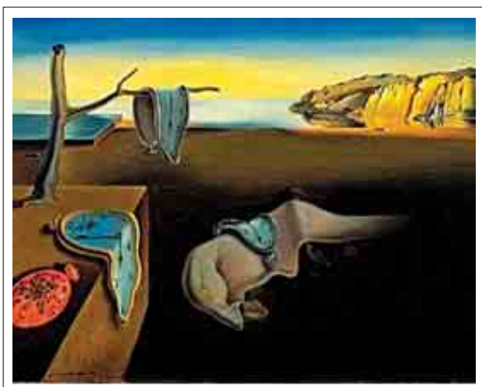
تصویر ۱۰: تصویرگر، سالوادور دالی

آنتونی براون از جمله تصویرگرانی است که در آثار خود از شیوه‌ی اقتباس با نگاهی خلاقانه سود می‌جوید. «کتاب‌های براون مملو از اشارات هوشمندانه به هنر کلاسیک،