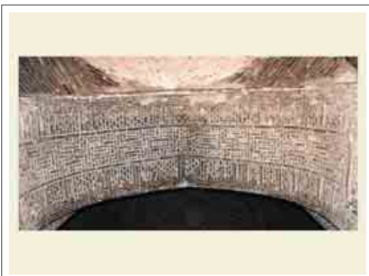
■ تصویر ۲: کتیبه هلال ورودی گنبدخانه

در قسمت ورودی اصلی به این بنا و در ضلع جنوبی گنبدخانه، در قسمت حاشیه هلال، خط کوفی ساده آجری به صورت برجسته دور تا دور هلال را پوشانده و در وسط آن فرم‌های هندسی آجری همراه با بندکشی‌های بسیار جذاب اجرا گردیده است. متن از سمت غرب و پایین قوس شروع می‌شود و شامل آیات ۲۶ و ۲۷ سوره آل عمران می‌باشد. (هنرفر، ۱۳۵۰، ۷۸) این کتیبه بسیار دقیق و با مهارت خاصی اجرا شده و تمام قوس را پوشانده است. «خواندن متن که از آیات قرآن می‌باشد بیننده را کمک می‌کند تا بیشتر در فضای معنوی مسجد قرار گیرد». (حلیمی، ۱۳۹۰، ۲۲۴)