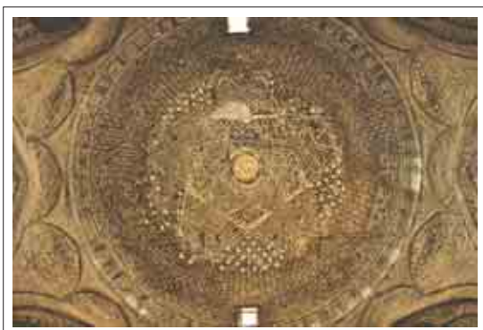
تصویر ۱۱: نقش داخل گنبد تاج الملک

در زیر گنبد که می‌توان به نوعی آنرا تزئین بی نظیر این قسمت قلمداد کرد، آجرها به گونه‌ای طراحی شده‌اند که با ترکیب اشکال هندسی چندضلعی، ستاره بزرگی پدید آمده است که می‌توان نقوش دیگری را نیز در این ستاره جستجو کرد. چرخش‌ها و عبور بی نظیر خطوط از روی هم نقش بسیار زیبا و چشم‌نوازی را در زیر گنبد ایجاد نموده که توجه هر انسانی را به خود جلب می‌کند. وجود ارتفاع این قسمت و تزئینات بسیار زیبای داخل گنبد نگاه را متوجه بالا می‌کند و انسان درگیر عظمت و بزرگی این عبادتگاه می‌شود و لحظه لحظه به یاد عظمت خداوند متعال می‌افتد. علاوه بر این چینش آجرها و بافتی که در این قسمت حاصل شده، بندکشی‌ها و مهره‌های گچی بسیار ارزشمند و بی‌نظیر می‌باشد و می‌توان حاصل دسترنج و هنر معماران ایرانی را مشاهده نمود. این نقش که نمونه آنرا در سایر بناهای اسلامی به ندرت میتوان مشاهده نمود، حاصل مهارت و خلاقیت معمارانی است که این گونه داخل گنبد را طراحی کرده و از کنار آن ساده عبور نکرده‌اند. در مجموع این گنبدخانه از جلوه‌های برجسته هنر سلجوقی محسوب می‌شود و با گذشت نزدیک به هزار سال هنوز با اقتدار پابرجاست و عظمت خاصی به مسجد جامع اصفهان بخشیده است.