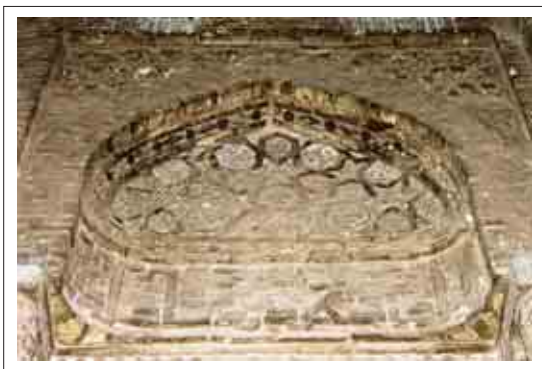
تصویر ۷: تزئینات قسمت شمال شرقی

در قسمت شمال شرقی و بالای کتیبه با نقوش هندسی بزرگ تزئین شده که چند ضلعی ها درشت تر و تفکیک شدت تر می باشند و نقوش ظریف گچی را احاطه کرده اند. در بالای این قسمت نقوش سه پر برجسته دیده می شود که بین آنها با نقوش گچی آرایش یافته و به تناوب تکرار شده و فضا را پوشانده اند.