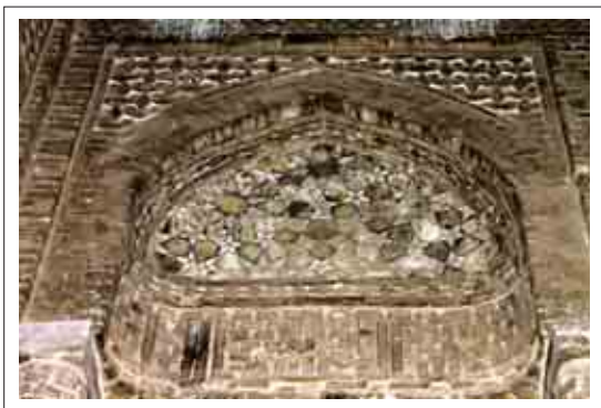
تصویر ۸: تزئینات قسمت جنوب شرقی

در قسمت جنوب شرقی یکی از طاق نماها نقوش تفکیک شده برجسته دارد و قسمت دیگری که روی ضلع جنوبی منطبق است دارای نقوش ستاره مانند برجسته منظم و نامنظم می باشد که به تناوب تکرار شده است. در بخش بالاتر اشکال هندسی لوزی ماندی طراحی شده که به گونه عمود روی هم نصب شده اند و تداعی کننده بافت یا شبکه حصیری می باشند.