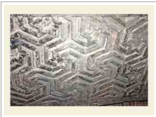
■ تصویر ۴: تزئینات ورودی شرقی برپایه ستاره شش وجهی

در بخش ورودی شرقی تزئینات زیبایی آجری بر پایه ستاره شش وجهی (شمسه شش و پیلی) می‌باشد که دارای جلوه‌های پویا و چرخشی است که بر اثر تکرار و پیوند ستاره‌ها در یکدیگر، بافت شکل هندسی زیبایی ایجاد کرده است. که با نمودی آستره هندسی و کاملاً تجسمی موجب شده که ماده ساختمانی به نظر نیاید و با واسطه آن سیر در عالم زیبایی ناب هندسه فراهم آید. این طرح بسیار متفاوت و تأمل برانگیز است و «هنرمند با کمترین امکانات مادی، خالص‌ترین اثر هنری فرازمان و فرامکان را بوجود آورده است». (همان، ۲۲۹)