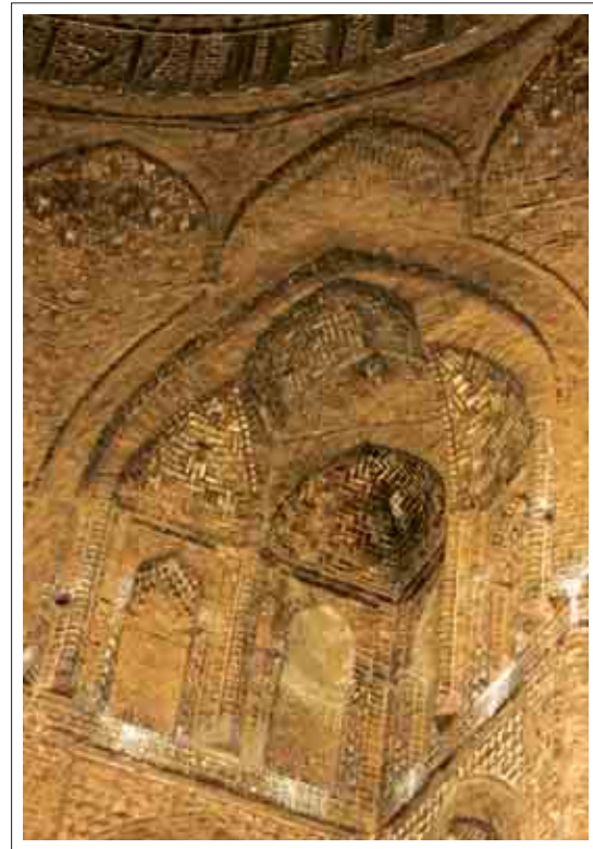
تصویر ۹: تزئینات پتکانه

دور تا دور ساقه گنبد کتیبه‌ای به خط کوفی ساده آجری برجسته می‌باشد که همچون کمربندی امتداد یافته است. متن کتیبه با بسم الله الرحمن الرحیم شروع می‌شود و با آیه ۵۴ سوره اعراف و نام بانی ساختمان، ابوالغنائم مرزبان ابن خسرو فیروز شیرازی (ملقب به تاج‌الملک) ادامه می‌یابد و در پایان سال ۴۸۱ هجری را نشان می‌دهد. (هنرفر، ۱۳۵۰: ۷۷) متن به شرح زیر است: «بسم الله الرحمن الرحیم ان ربکم الله الذی خلق السموات و الارض فی سته ایام ثم استوی ... امر ببناء هذه القبه ابوالغنائم المرزبان بن خسرو فیروزختم الله بالخیر فی شهر سنه احدی و ثمانین و اربع مائه» در بالا و پایین این کتیبه دونوار که دارای تزئینات آجری می‌باشند قرار گرفته است. در زیر این کتیبه در ۳۲ پشت بغل موجود است که در هر یک از آنها دو کلمه به خط کوفی ساده با آجر به صورت برجسته اسامی و القاب خداوند نوشته شده است. (همان، ۷۸، ۷۹) که به شرح زیر می‌باشد: