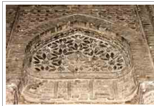
تصویر ۵: تزئینات قسمت جنوب غربی

گسترش حس دینی و مذهبی شده و از بعد مادی و سخت مواد و مصالح کاسته و باعث ایجاد بعد معنوی و روحانی می گردد. در بالای کتیبه ها با آجرهای تراشیده ترکیب های گوناگون هندسی پدید آمده است. آنچه که مهم به نظر می آید و نشانگر ذوق و خلاقیت معماران ایرانی می باشد، این است که در هر قسمت تزئینات متفاوت و گوناگون می باشد؛ یعنی بار دیگر با تنوع و کثرت تزئینات روبرو هستیم که یکی از ویژگی ها و امتیازات تزئینات اسلامی می باشد. در بالای کتیبه ضلع جنوب غربی نقوش هندسی ظریف و زیبا به صورت ستاره و گل بوسیله آجر تراش داده شده و گچ، طراحی و اجرا گردیده است. این تزئینات در نهایت دقت و زیبایی اجرا گردیده و از یکنواختی فضا کاسته است. در بالای تزئینات مذکور نقوش چلیپایی ساده و به طرز برجسته به صورت متناوب دیده می شود. همانگونه که می دانیم نقش چلیپا در فرهنگ ما پیشینه ای طولانی دارد و معمار نابغه به طرز هوشمندانه از این طرح استفاده نموده و برای تزئین این قسمت از آن بهره برده است.