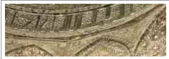
تصویر ۱۰: کتیبه ساقه گنبد و اسما الهی

تکرار اسما مقدس الهی و آیات قرآن بر تقدس این مکان می‌افزاید و بیش از هرچیز آنرا به مکانی روحانی و معنوی تبدیل می‌کند و مکانی را خلق می‌کند که سرتاسر معناست و تاکید بیشتری بر این عبادتگاه می‌کند.