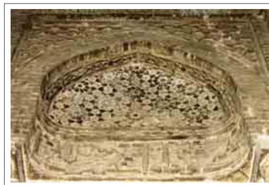
تصویر ۶: تزئینات قسمت شمال غربی

در قسمت شمال غربی و در بالای کتیبه تزئینات بسیار ظریف و ریز به شکل چند ضلعی های منظم و نامنظم اجرا شده است که از لحاظ ظرافت بسیار، شبیه نقوش خاتم کاری می باشد. در بخش بالاتر با ستاره های ۶ پر برجسته که در وسط آنها نیز نقوش ساده گچی طراحی شده، زینت یافته که مجدداً شاهد تکرار این ستاره ها می باشیم.