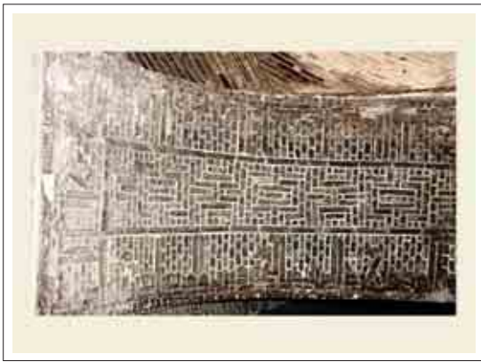
■ تصویر ۳: کتیبه خط کوفی آجری

در بخش ورودی شرقی تزئینات زیبایی آجری بر پایه ستاره شش وجهی (شمسه شش و پیلی) می‌باشد که دارای جلوه‌های پویا و چرخشی است که بر اثر تکرار و پیوند ستاره‌ها در یکدیگر، بافت شکل هندسی زیبایی ایجاد کرده است. که با نمودی آستره هندسی و کاملاً تجسمی موجب شده که ماده ساختمانی به نظر نیاید و با واسطه آن سیر در عالم زیبایی ناب هندسه فراهم آید. این طرح بسیار متفاوت و تأمل برانگیز است و «هنرمند با کمترین امکانات مادی، خالص‌ترین اثر هنری فرازمان و فرامکان را بوجود آورده است». (همان، ۲۲۹)